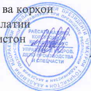
Насурдинзода Аслиддин Насурдин

Сардори раёсати кадрҳо, коргузори ва корҳои махсуси Академияи идоракунии давлатии назди Президенти Ҷумҳурии Тоҷикистон